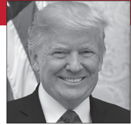
Donald Trump Republicano donaldjtrump.com